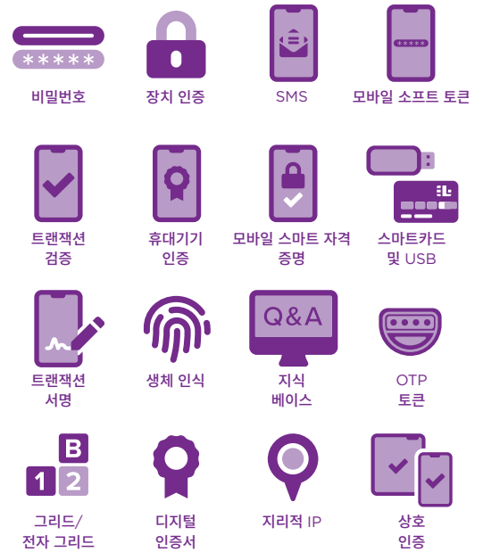
Entrust Datacard - 인증 세트 OTP 및 인증서 기반 인증 옵션

Entrust Identity Enterprise는 nShield HSM과 통합되어 핵심적인 서명과 암호키를 보호하고 신원 관리 시스템에 대한 신뢰점을 제공합니다.